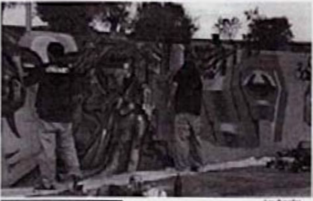
JORNADA Crece el número de participantes pero no de espectadores