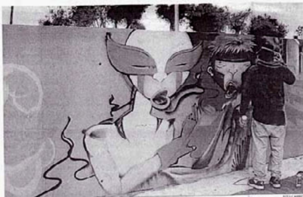
Uno de los graffitis realizados por los participantes en la avenida Ronda de Valencia.

El programa juvenil perteneciente a la asociación Andad realizó una exhibición de esta técnica en Ronda de Valencia