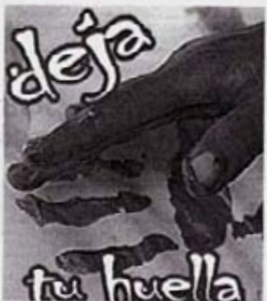
El cartel de uno de los proyectos de voluntariado.

Una de las charlas breves a cargo en el IES José Luis Tejada sobre temas variados.