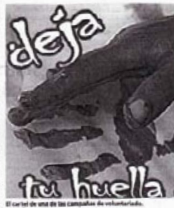
El cartel de una de las campañas de voluntariado.

Una de las charlas llevadas a cabo en el IES José Luis Tejedor sobre temas variados.