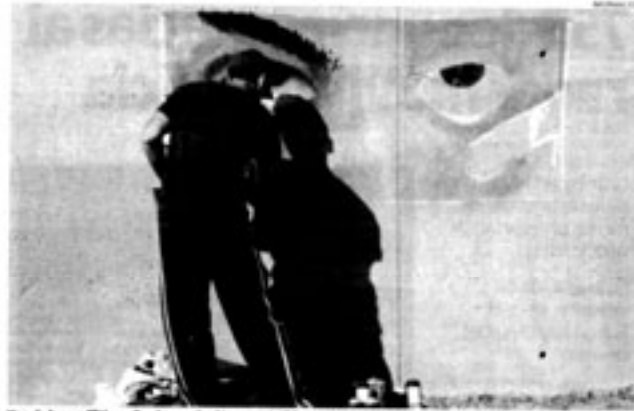
Uno de los graffitis realizados por los jóvenes participantes en esta actividad de Nexojoven.

Nexojoven reúne a una veintena de chavales en la actividad central del mes de la juventud